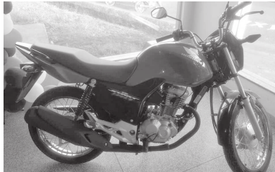
Motocicleta que será sorteada na ação social esteve exposta esta semana na Casa Casa

A comissão organizadora também ressalta que estão à venda os pacotes para o estacionamento de veículos para as quatro noites do evento. Elas serão realizadas no Auto Posto Paraiso. As informações podem ser obtidas no telefone (18) 3341-1035.