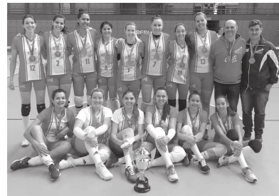
Meninas do vôlei de CM, que conquistaram a medalha de bronze nos 'Regionais'

"A competição foi muito dura e todas as equipes são fortes. Lutamos pelo ouro como no ano passado, mas a competição esteve em um nível muito forte, por isso, essa medalha de bronze foi muito comemorada pela comissão técnica, atletas e Secretária de Esporte e Turismo (SET). Isso mostra mais uma vez