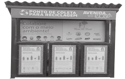
Posto de Entrega Voluntária vai ser inaugurado no estacionamento da loja 11 da Rede Avenida em CM