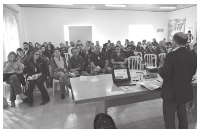
Da Redação Assis

A parceria firmada entre o Sincomerciários de Assis e a faculdade Anhanguera promoveu uma série de palestras sobre o E-Social, com a consultoria TBS de Marília nos dias 12 e 13 de julho, ministradas por José