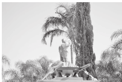
Veículo com imagem de São Cristóvão abriu carreta com terminou com a bênção dos veículos