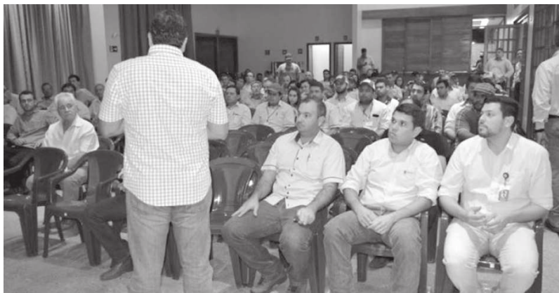
Da Redação Cândido Mota

Pelo menos 150 produtores, além de membros do corpo técnico da cooperativa e colaboradores da Coopermota, participaram da