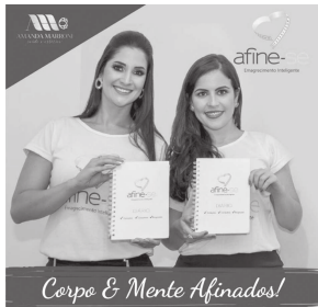
Corpo & Mente Afinados!

método são ajustadas as estratégias necessárias para que o paciente emagreça de forma inteligente e sustentável.