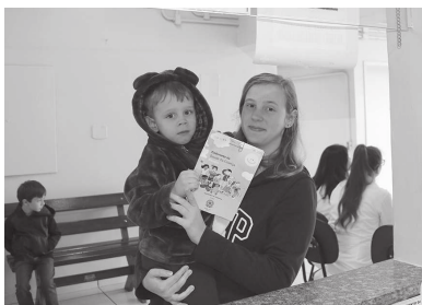
359 crianças receberam a dose contra a polio e 363 contra a tríplice viral

25,85% da vacinação contra a poliomielite e 26,13 contra o sarampo, da meta estabelecida pelo Ministério da Saúde, que é de 95%. O balanço foi divulgado pela prefeitura de Cândido Mota através da Vigilância Epidemiológica