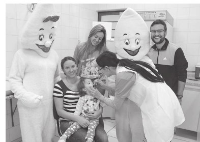
Unidades de saúde de CM ficaram abertas no sábado para a vacinação das crianças