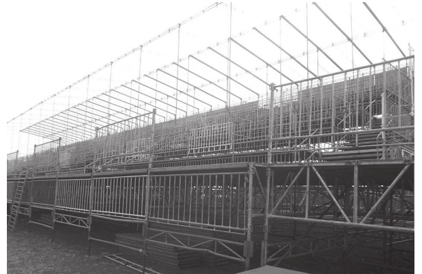
Recinto está sendo preparado para abertura do rodeio, que acontece na noite desta quinta-feira

Estarão em Cândido Mota os mais premiados peões do país. Eles irão disputar uma premiação de R$ 30 mil, que será dividi-