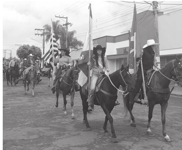
Cavalgada aconteceu na manhã deste domingo e percorreu principais ruas de CM