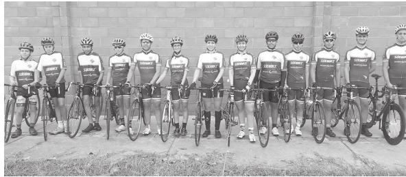
Cândido-motenses fazem parte da equipe de Ciclismo de Assis

“A ideia era apenas assistir e torcer, mas daí o DNA de ciclista falou mais alto e resolvi correr. Procurei não me esforçar e apesar de me empolgar no co-