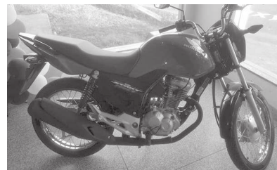
Motocicleta é o principal prêmio da ação social que rodeio e Fundo Social promovem para Santa Casa

Na primeira atividade, a ‘Ação Social’, estão sendo comercializados cupons a R$ 10, que dão direito ao comprador de participar do sorteio de uma moto CG 160 start, uma TV de 42 polegadas e outra TV de 32 polegadas. O