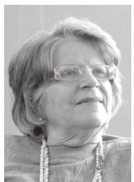
Candidata ao Governo de São Paulo pelo PSOL também vai estar à tarde em 'O Diário do Vale'