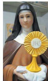
Programação acontece no Santuário de Santa Clara, em CM