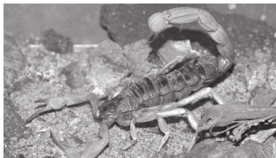
O escorpião amarelo ou TityusSerrulatus, é uma espécie muito bem adaptada ao ambiente urbano

São animais peçonhentos que injetam veneno por um ferrão na ponta da cauda e o acidente ocorre, geralmente, quando a vítima encosta no animal com as mãos ou com os pés. A picada do animal pode acar-