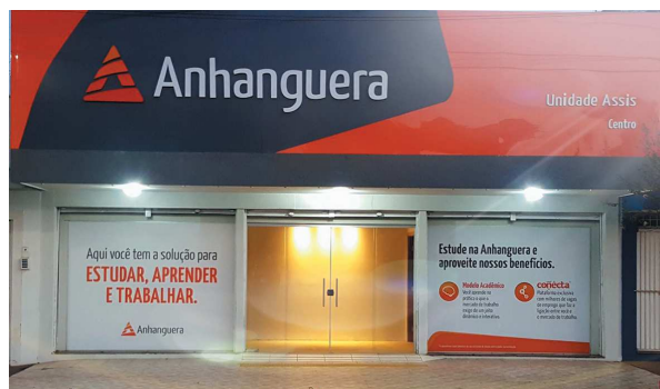
Anhanguera em Assis está localizada no centro da cidade, em área privilegiada

ton, um dos maiores conglomerados educacionais privados do mundo. A Faculdade Anhanguera é uma instituição que oferece educação de referência em mais de 150 unidades em todo o Brasil. EDUCAÇÃO Página 4