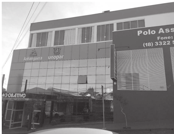
Instalações modernas e amplas no centro de Assis garantem fácil localização da Faculdade

De acordo com Junqueira, para democratizar o ingresso do estudante ao