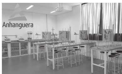
Faculdade já possui todos os laboratórios instalados para cursos que serão oferecidos na região