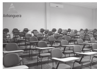
Salas de aula são confortáveis e preparadas para o bom aprendizado dos alunos

A Faculdade Anhanguera fica em uma ampla e moderna sede, na avenida Rui Barbosa, 1441, no centro de Assis. Outras informações podem ser obtidas pelos telefones (18) 99112-1339 e (18) 99150-3717. (Colaborou Assessoria de Comunicação)