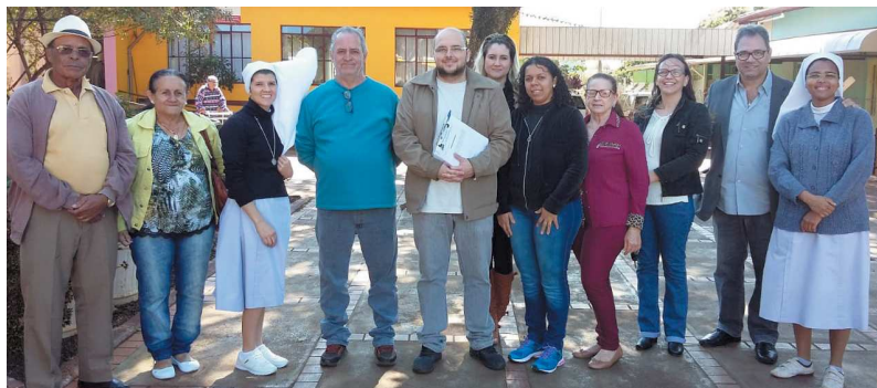
Membros do CMI e dirigentes das entidades, com as religiosas e os atendidos nos dois projetos