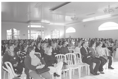
Funcionários da Secretaria da Educação ficaram satisfeitos com o resultado obtido no Ideb

A meta estabelecida pelo Ministério da Educação para o município de Cândido Mota é 6,3. Mas, a rede municipal atingiu a nota 6,5, superando o percentual estabelecido