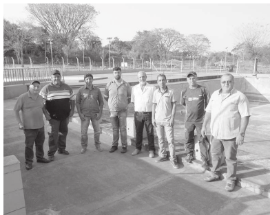
Vereadores estiveram com secretários municipais visitando obras na piscina pública