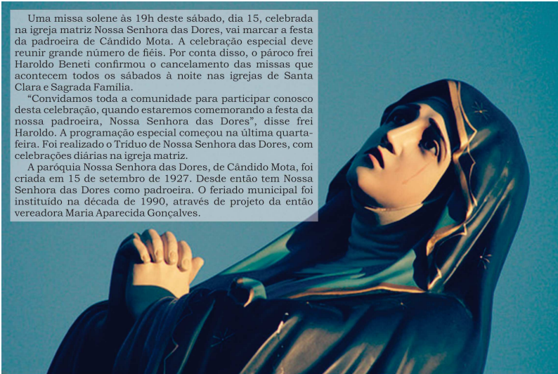
Celebrações da padroeira acontecem na igreja matriz Nossa Senhora das Dores, em Cândido Mota