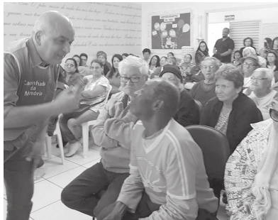
Da Redação Cândido Mota