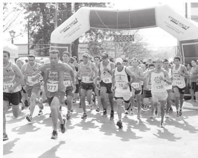
Na manhã de 23 será realizada a largada da 4ª Corrida de Pedestre e Caminhada

O município de Pedrinhas Paulista comemora 66 anos e será realizada uma grande programação de eventos pela prefeitura para comemorar a data. As atrações começaram nesta quarta-feira, dia 19 setembro, no Centro Cultural, com o evento 'A História do Crostoli' (com as nonnas do município mostrando os segredos e os tipos desta deliciosa sobremesa típica italiana) e a exposição 'Chargeando', do chargista e cartunista Renato Piovani. Neste dia 20 ocorre o 'Sarau na Praça' na praça Monsenhor Ernesto Montagner, com diversas atrações culturais e artísticas. No dia 21, feriado de aniversário da cidade,