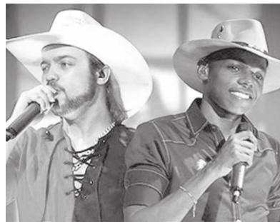
Festividades serão fechadas com show de Lucas Reis & Thácio na noite de domingo, dia 23

No dia 22 acontece 'Futebol com autoridades - Executivo x Legislativo', às 9h30, no estádio municipal. À noite, às 20h, ocor-