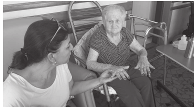
Moradoras do asilo ficaram satisfeitas com a ação do Fundo Social e disseram 'querer mais vezes'