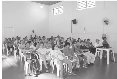
Atividades acontecem durante toda a semana; abertura recebeu público no Cras

A segunda-feira começou animada no auditório do Centro de Referência de Assistência Social de Cândido Mota, o Cras. Aconteceu a abertura da Semana do Idoso, com a presença do prefeito Roberto Bueno, secretários municipais, funcionários da Secretaria de Assistência Social, representantes de entidades e os homenageados da programação, que são os idosos. Realizada pela prefeitura de Cândido Mota através da Se-