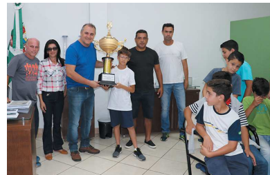
ESPORTE Página 3