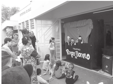
Para atrair as crianças, a Secretaria da Saúde promoveu várias brincadeiras na UBS Central

extrema importância, principalmente por zerar a demanda entre as crianças. Gostaria de aproveitar a oportunidade e agradecer a equipe da Secretaria de Saúde por mais este evento de prevenção e promoção à saúde", finalizou.