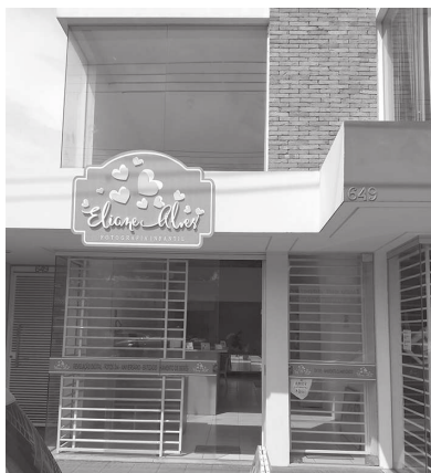
Estúdio Eliane Alves fica na rua Ângelo Pipolo, 649, no centro de CM

newborn, coberturas de batizados, aniversários e casamentos, confecção de álbuns personalizados. A loja também irá oferecer produtos, como álbuns e porta-retratos.