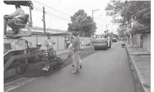
Rua Antonio Dias da Silva e rua Paschoal Mussolini, nas casas populares, foram algumas das ruas recuperadas em Cândido Mota