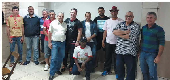
Da Redação Cândido Mota

Foi criada durante uma reunião de esportistas de Cândido Mota, na noite de