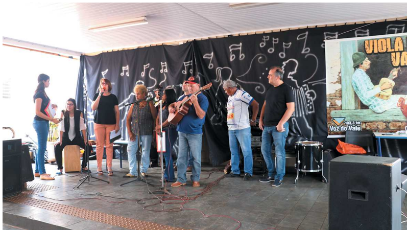
Grupo 'Vozes Livres', da Oficina de Música do Caps, esteve ao vivo no programa da Voz do Vale