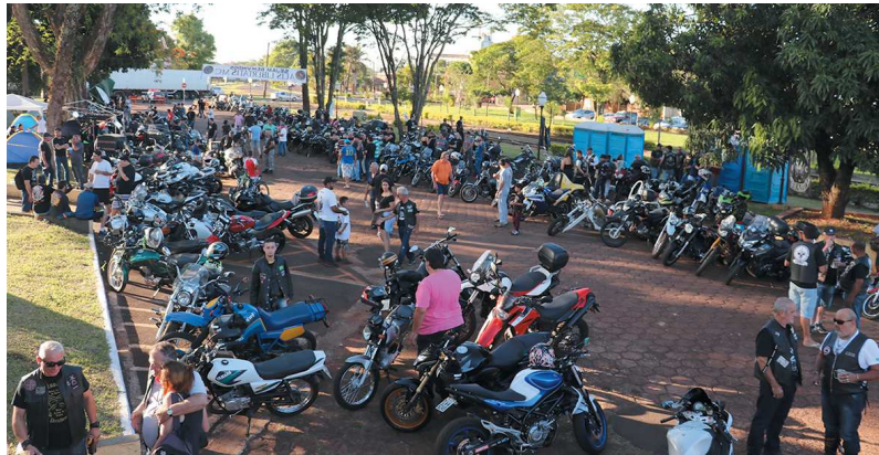
IV Encontro de Motociclistas e Triciclistas aconteceu no sábado e domingo, na praça 'João XXIII'