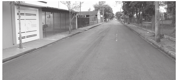
A rua Antonio Paulino Barreiros recebeu recuperação do pavimento asfáltico