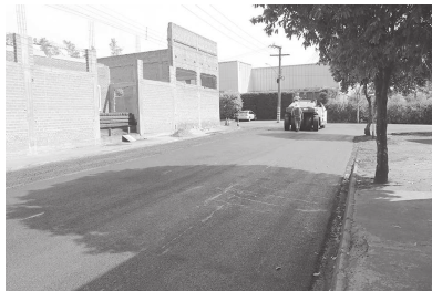
Ruas João Jacinto do Amaral e João Dias Gimenes também foram recapadas

é isto que buscamos sempre. Estamos como representantes do povo, em busca do melhor para o cidadão e é isto que fazemos desde o início do mandato e iremos fazer. Trabalhando juntos, o resultado é observado a olho nu. As máquinas, caminhões da empresa contratada através de tomada de preço, realizam o trabalho e são observados pelos moradores das ruas, do início ao fim do serviço, que vão se transformando em pavimento com qualidade e segurança para os motoristas e pedestres".