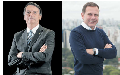
Jair Bolsonaro conseguiu a vitória em todos os municípios da região João Dória venceu em quase todas as cidades da região do Médio Paranapanema

Da Redação Cândido Mota Um dos slogans de campanha do então candidato ao governo pelo PSDB, João Dória, para evidenciar o seu apoio ao candidato pelo PSL à Presidência, Jair Bolsonaro, no segundo turno das eleições, foi confirmado nas urnas em quase todas as cidades da região. Apenas Florineia e Platina não confirmaram a 'dobradinha'. Nos demais municípios, Bolsonaro e Dória venceram e reafirmaram a vitória nas urnas em nível estadual e nacional. O candidato à presidência Jair Bolsonaro, eleito com 55,13% dos votos no país, contra 44,87% de Fernando Haddad, do PT, teve 77,79% dos votos em Cândido Mota, com 12.990 votos. Fernando Haddad conseguiu 3.708 votos, ou 22,21%. A taxa de ausentes foi de 24,40%, ou 6.085 eleitores. Houve ainda 570 votos brancos, ou 3,02%, e 1.581 nulo, um total de 8,39%. ELEIÇÕES 2018 Página 3