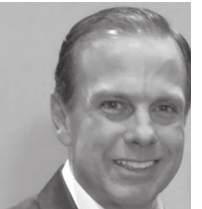
João Dória venceu em quase todas as cidades da região do Médio Paranapanema

a criminalidade'. Ele foi entrevistado pela rádio Bandeirantes. Dória recebeu do futuro ministro da Fazenda no governo Bolsonaro a garantia de que o pacto federativo será revisto. O tucano fez outra revelação durante a entrevista, a respeito de uma conversa que teve com Paulo Guedes na madrugada desta segunda-feira. Segundo ele, o 'guru econômico' de Bolsonaro disse que o presidente eleito vai mesmo rever modelo de relacionamento do governo federal com os Estados.