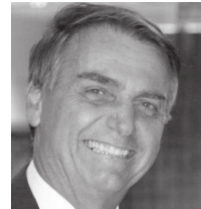
Jair Bolsonaro conseguiu a vitória em todos os municípios da região

Justiça O governador eleito João Dória revelou ontem que o novo secretário da Segurança Pública de São Paulo 'não será um promotor de Justiça, como se tornou regra nos últimos anos'. Sem adiantar o nome, definiu claramente o perfil para o cargo; 'um policial com bastante experiência para enfrentar