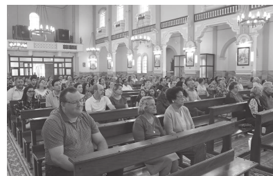
Secretários municipais participaram da celebração que marcou 95 anos de CM

dia 1ª, às 21h, na praça Monsenhor David, no centro da cidade. A abertura do campeonato interno de futebol de salão da escolinha do município foi transferida para esta quinta-feira, dia 1ª, às 19h, no ginásio poliesportivo 'Hamilton Scapim'.