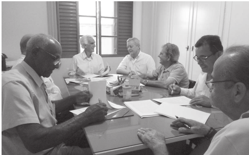
Dirigentes dos sindicatos rurais e dos sindicados dos trabalhadores rurais durante reunião do acordo coletivo