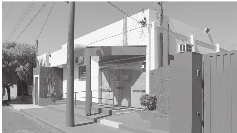
Saae de Cândido Mota entra na era do atendimento eletrônico e ajuda cliente a organizar dia