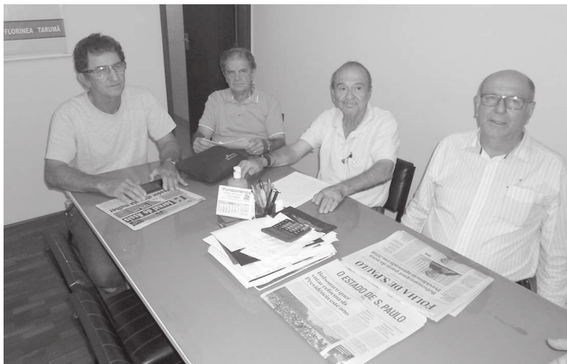
Dirigentes dos sindicatos rurais da região se reuniram para tratar sobre as regras do comércio de defensivos