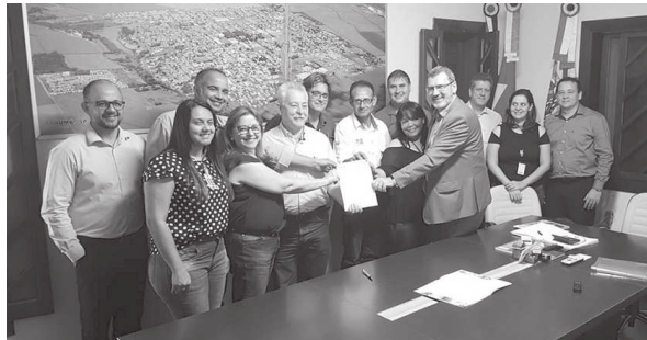
Prefeito Oscar Gozzi e vice Fernandes Baratela durante solenidade em que foi anunciada captação de recurso junto à CEF

Oscar Gozzi salientou que a ‘captação de recursos é uma ação concreta, levando o lema Saúde em primeiro lugar, que faz parte dos compromissos de seu plano de governo’. “A construção de um Instituto de Saúde em Tarumã faz parte dos nossos compromissos de campanha. Vamos melhorar a qualidade da saúde para nossa população, pois isso aumenta a longevidade das pessoas, um dos indicadores que também incrementam o nosso Índice de Desenvolvimento Humano (IDH), já que almejamos estar, em um médio prazo, entre as 10 melhores cidades do Brasil para se