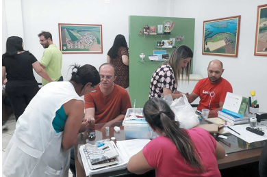
A prefeitura de Cândido Mota por meio da Secretaria de Saúde, realizou na última quarta-feira, dia 14, ação de alerta sobre a importância da prevenção e controle do diabetes e suas complicações. SAÚDE Página 11

Dia Mundial do Diabetes Prefeitura de CM realiza ações sobre prevenção e combate ao diabetes