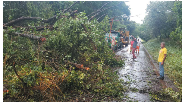
O vento forte que atingiu a região na tarde de quarta-feira, dia 14, derrubou uma árvore de grande porte e bloqueou completamente a rodovia Francisco Gabriel da Mota (SP 266), entre Cândido Mota e o distrito de Nova Alexandria, próximo a água da Pirapitinga. A equipe do Corpo de Bombeiros foi acionada e em pouco menos de cinco minutos liberou parcialmente a pista, que foi totalmente liberada cerca de uma hora depois.