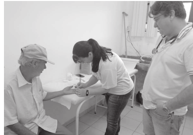
Funcionários da prefeitura estiveram realizando o exame preventivo do diabetes

"O diabetes é uma doença crônica muito séria, que pode ocasionar complicações graves, inclusive levar à morte. Portanto, é um problema que não pode ser ig-