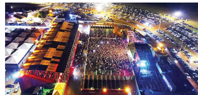
CIDADE Página 6

Clube de Rodeio anuncia que ação social do 'Gigante Vermelho' pode alcançar R$ 120 mil