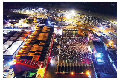
Ação social do rodeio Gigante Vermelho para a Santa Casa pode atingir R$ 120 mil arrecadados