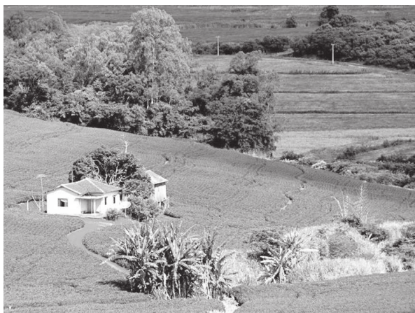
Medida beneficiará pequenos e médios produtores; interessados podem realizar contratação a partir desta quarta-feira, dia 21

O benefício será concedido por intermédio das companhias seguradoras, mediante a dedução do montante correspondente ao valor da subvenção estadual do prêmio de seguro rural a ser pago pelo produtor.