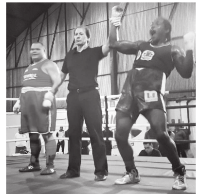
Boxeador de CM, que lutou por Osasco, é anunciado vencedor pelo juiz