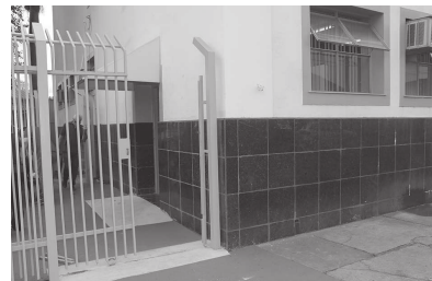
Antigo espaço da Câmara de Vereadores foi adaptado para receber repartições do 'Ganha Tempo'