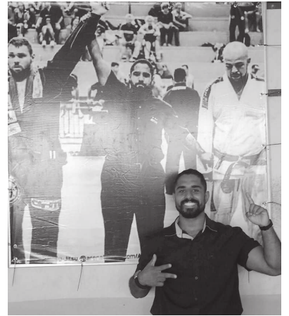
'Sensei' começou no esporte há 16 anos e hoje se tornou mestre em artes marciais