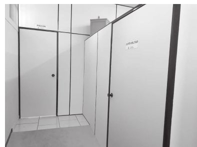
'Ganha Tempo' será colocado em funcionamento a partir das 8h desta terça-feira