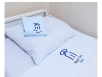
melhor organização interna e conforto aos pacientes" (Colaborou Assessoria)