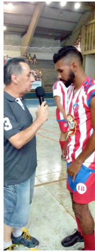
Acougue São Caetano e Dias Zonfrili Advogados.

A rodada de quarta-feira teve a vitória do Supermercado Avenida sobre Gilmar Construções por 5 a 3 e a vitória de Mix Cosméticos/Zequi lanches de 3 a 2 sobre o time da Cimencal. A próxima rodada acontece nesta sexta-feira, no ginásio 'Hamilton Scapim'. A partir das 19h30 jogam Barcelona Pães e Doces contra O Barateiro. Em seguida, às 20h30, enfrentam-se