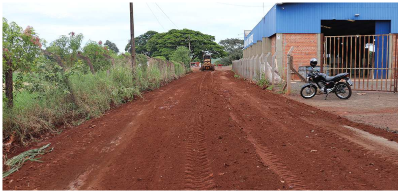
Estrada tem várias chácaras e empresas em sua extensão, e dará acesso à Coopershow