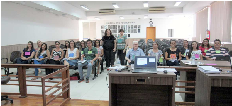
Curso inédito no município, promovido pelo Cejusc de Cândido Mota, em parceria com Cejusc de Palmital, acontece na Câmara de Cândido Mota