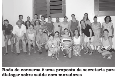
Roda de conversa é uma proposta da secretária para dialogar sobre saúde com moradores