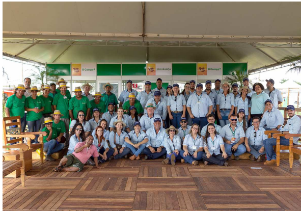
Diretores da Coopermota e funcionários que atuaram na 13ª Coopershow

trabalhadores e público visitante. A participação do público agradou a organização, que contabiliza um número recorde em relação às edições anteriores. AGRICULTURA Páginas 11 e 12