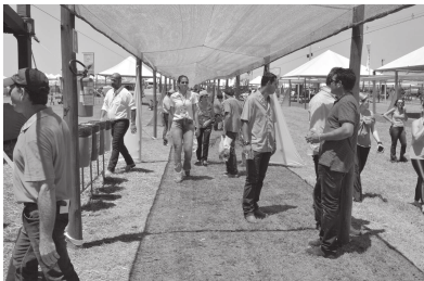
A 13ª Coopermota bateu recorde quanto ao número de visitantes e expositores

Diferentes abordagens Uma dezena de palestras foram oferecidas aos visitantes da 13ª Coopermota, com a participação de diferentes especialistas nos temas que envolveram o manejo de ervas daninhas, percevejos e nematoides, estes com pesquisadores da Embrapa, além de técnicas de enfrentamento ao veranico, mecanismos de irrigação em diferentes sistemas, alternativas de transformação da energia solar, entre outros.