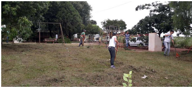
Da Redação Cândido Mota

O projeto 'Cidadania em Ação' se uniu ao projeto 'Amigos da Praça', ambos da prefeitura de Cândido Mota, para oferecer ação de limpeza completa aos moradores do patrimônio São Benedito, no município de Cândido Mota. O trabalho foi executado durante toda esta quinta-feira, dia 14, na praça central e em vários pontos que necessitavam de limpeza e manutenção. CIDADE Página 3