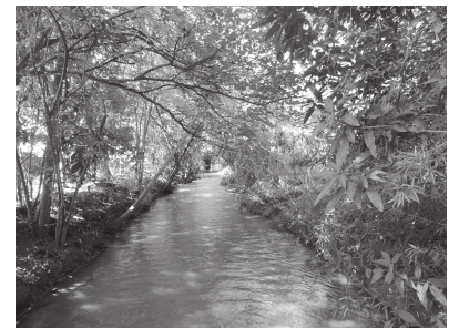
Conservação e manutenção da lagoa é missão de todos os cidadãos