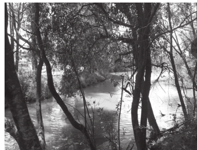
Lagoa Taquara Preta é uma das nascentes que fazem parte do projeto 'Nascente Modelo'