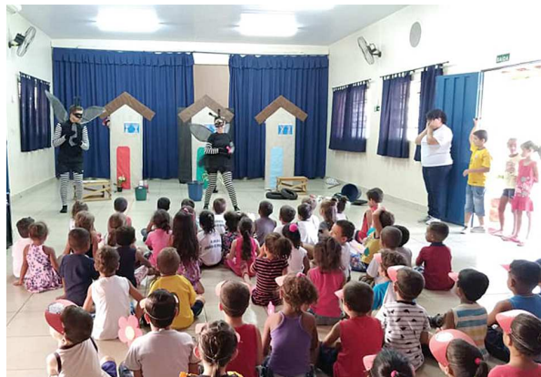
Alunos participam da peça 'Os três porquinhos e os mosquitos maus'