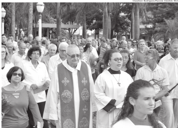
Procissão na praça Mosenhor David marcou o Domingo de Ramos em CM

duo Pascal é ponto culminante da Semana Santa. "Não se trata de um tríduo preparatório para a festa da Páscoa, mas são três dias de Cristo crucificado, morto e ressuscitado. Tem