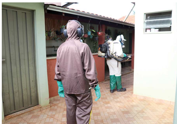
Agentes de vetores fizeram a nebulização na região onde os casos de dengue foram confirmados