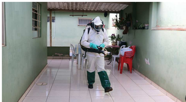
Agentes fizeram a nebulização na região onde os casos foram confirmados

demiológica confirmada pela Secretaria de Saúde indica que de janeiro até o momento foram realizadas 111 notificações, com seis casos positivos, 70 negativos, 19 aguardando coleta ou resultado e 16 recusas. CIDADE Página 6