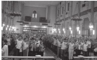
triz, as atividades atraíram grande público. O pároco, frei Haroldo Be-

As celebrações da Semana Santa na paróquia Nossa Senhora das Dores, em Cândido Mota, reuniu milhares de fieis, seja nos templos ou nas ruas, nas procissões. Desde o Domingo de Ramos, passando pela Segunda Feira Santa, quando aconteceu a celebração da reconciliação, a Terça-Feira Santa com a 'Procissão dos Passos (Via-Sacra) pelas ruas do centro da cidade e celebrações na igreja ma-