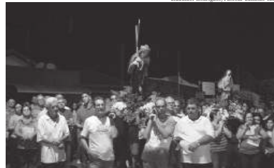
parada pela Paróquia Nossa Senhoras das Dores. "Obrigado a todos os fieis de Cândido Mota. Deus os abençoe", disse. Ele citou, por fim, grande presença de fieis nas ce-

neti, agradeceu a comunidade por participar tão ativamente da programação pre-