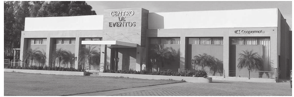
Jantar Dançante das Mães será realizado no Centro de Eventos da Coopermota