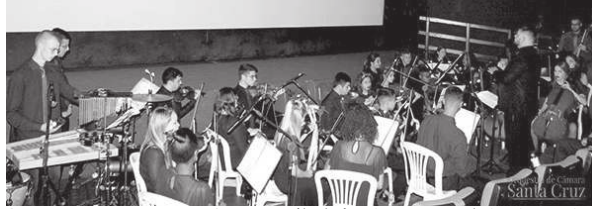
Orquestra se apresenta em CM neste sábado à noite na praça da igreja matriz

Entre as canções a serem executadas estão 'Abertura dos Desenhos Walt Disney', 'Frozen - Let It Go', 'Rei Leão - Can You Feel The Love Tonight', 'A Bela e a Fera - Sentimentos', 'Rio - Fly Love e Garota de Ipanema', 'Star Wars - The Imperial March e o Tema Principal', 'X-men - Sweet Dreams', 'Harry Potter - Tema principal', 'Piratas do Caribe - He's a Pirate', 'The Jaws - Tema Principal', 'O Exorcista - The Exorcist Theme', 'Jurassic Park - Tema principal', 'Indiana Jones - Tema Principal' e 'Mudança de Hábito