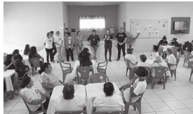
Houve troca de experiências e confraternização entre jovens e idosos