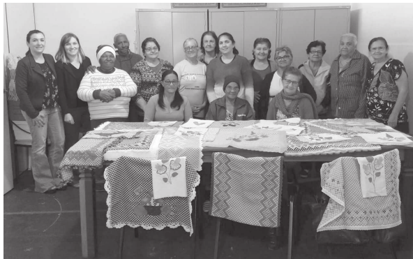
Integrantes e coordenadores dos projetos mostram trabalhos produzidos no Cras

O Cras em Cândido Mota está localizado na rua Jerônimo Plauzino Barbosa, 251. A unidade funciona de segunda-feira a sexta-feira, das 7h30 às 17h.