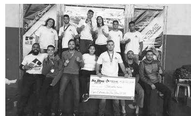
Atletas e dirigentes de CM que estiveram na Copa X-Treme em Ourinhos