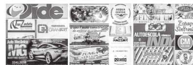
Patrocinadores da equipe cândido-motense que apoiou na competição em Ourinhos