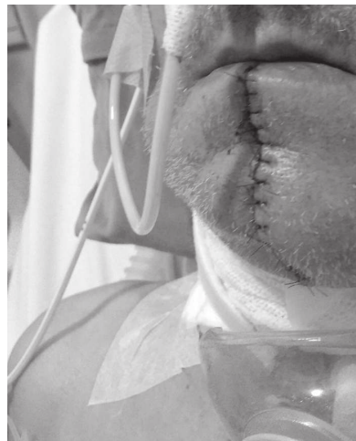
Esposo de Rosi Ribeiro está em tratamento por conta de problemas originados pelo tabagismo

E completou: "segundo números divulgados pelo Instituto Nacional do Câncer, cerca de 90% dos casos de câncer de pulmão são atribuídos a cigarro e doenças cardiovasculares. Desses, 40% mostram o quanto é importante trabalharmos com a prevenção e o combate ao tabagismo", falou o prefeito Roberto Bueno.