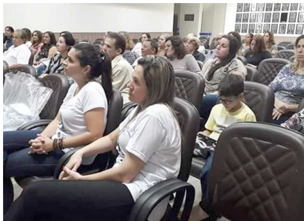
Da Redação Cândido Mota

A Prefeitura de Cândido Mota através da Secretaria de Saúde vêm realizando mês a mês a campanha de cores de prevenção. O mês de maio, cinza, é alusivo à conscientização contra o tabagismo, tendo 31 de maio como o 'Dia Mundial Sem Tabaco'. Entre as ações realizadas está a capacitação de profissionais da Secretaria de Saúde que participaram de curso para a abordagem intensiva do fumante, ofertado pelo Centro de Referência de Alcool, Tabaco e Outras Drogas, 'Cratod', ocorrido em abril em Marília. CIDADE Página 3