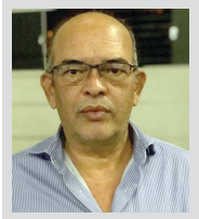
Da Redação Cândido Mota

Advogado cândido-motense sofre infarto em Guarulhos