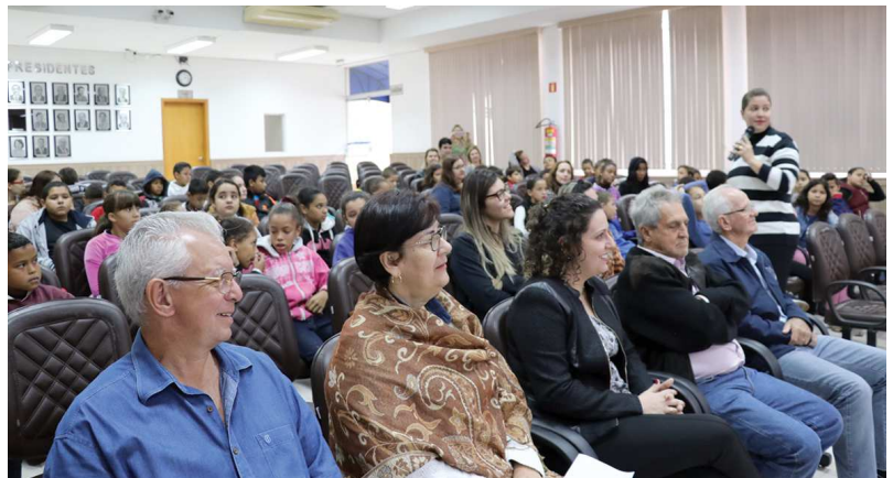
Cândido Mota