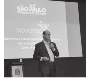
Secretário de Educação de São Paulo, Rossieli Soares

mento, como Tecnologia da Informação e Comunicação; Recursos Natu-