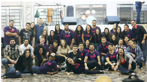
Membros do Rotaract Clube de CM após a quermesse da última sexta-feira

O Rotaract Clube é parceiro do Rotary Clube de Cândido Mota e desenvolve projetos no município há 20.