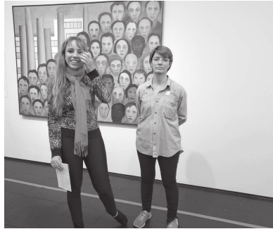
Estudantes de Fotografia e Publicidade e Propaganda fizeram viagem a SP, onde visitaram inúmeros museus e conheceram pontos da cidade