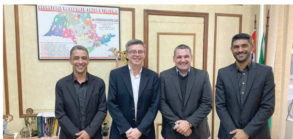
Vereadores cândido-motenses está com o secretário geral da Secretaria de Esporte de SP

“Temos as portas abertas tanto na Alesp como na Câmara dos Deputados, em Brasília, para reivindicar o melhor para nosso município. Por isso estamos em busca de recursos, sempre no sentido de buscamos uma Cândido Mota melhor para se vi-